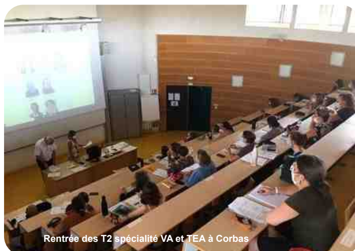
Rentrée des T2 spécialité VA et TEA à Corbas