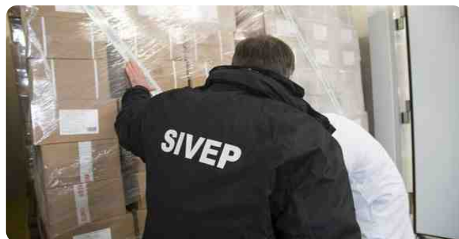
Contrôle à la frontière par un inspecteur du SIVEP

La classe virtuelle sera privilégiée, pour réduire les déplacements des stagiaires et des formateurs et limiter les contacts dans le contexte sanitaire actuel. Au préalable, les futurs formateurs qui le souhaitent ont suivi des formations à l'animation de classes virtuelle proposées par l'Infoma.