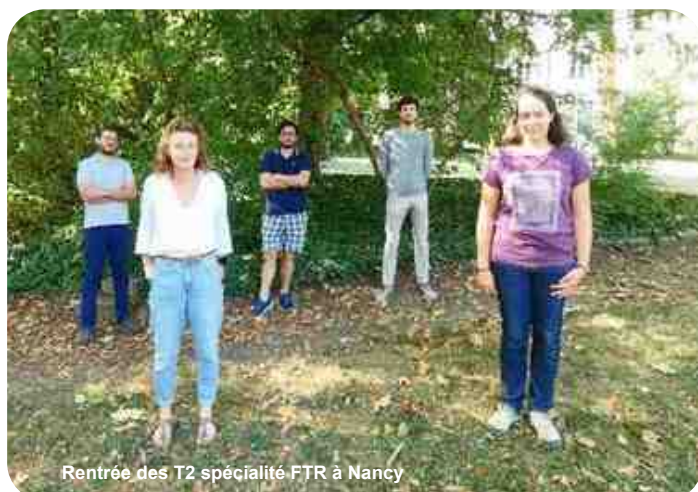
Rentrée des T2 spécialité FTR à Nancy

Souhaitons-leur de profiter au maximum de leur formation malgré les conditions si particulières liées à la crise sanitaire.